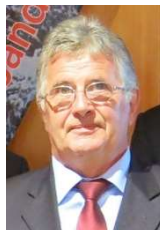
Präsident des Tiroler Rodelverbandes