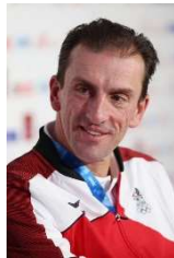
Markus Prock ÖRV-Präsident

Sehr geehrte Damen und Herren, liebe Rodelsportfreunde!